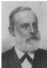
Lothar Meyer 1830 - 1895

Децембра 2017. године, на 74. пленарном састанку Генералне скупштине УН, 2019. година је проглашена Међународном годином периодног система елемената (International Year of the Periodic Table of Chemical Elements - IYPT 2019). На тај начин обележава се 150 година од када је Димитриј Менделејејев, фебруара 1869. године, објавио свој чланак у Часопису Руског физичко-хемијског друштва, и у њему презентовао периодни закон и