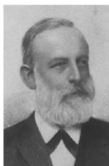
Lothar Meyer 1830 - 1895

Децембра 2017. године, на 74. пленарном састанку Генералне скупштине УН, 2019. година је проглашена Међународном годином периодног система елемената (International Year of the Periodic Table of Chemical Elements - IYPT 2019). На тај начин обележава се 150 година од када је Димитриј Мендељејев, фебруара 1869. године, објавио свој чланак у Часопису Руског физичко-хемијског друштва, и у њему презентовао периодни закон и